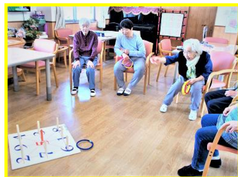
写真は、「輪投げゲーム」のご様子です。