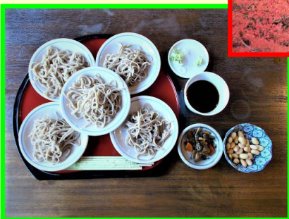
「塩田の館」の皿蕎麦です。 美味しかった…ごちそうさまでした。