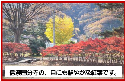
信濃国分寺の、目にも鮮やかな紅葉です。