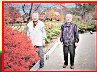
「前山寺」の紅葉、見事です。