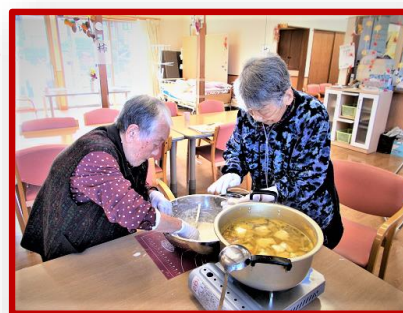
写真は、「すいとん作り」を楽しまれておられるご様子です。