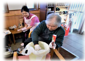
写真は、「野沢菜漬け」のご様子です

懐かしいご家庭の味「野沢菜漬け」「白菜漬け」 を皆さんと共に漬けてご賞味いたしましょう！