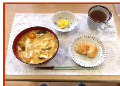
写真は、冬至料理の一環として作ったカボチャほうとうと焼おにぎりの写真です。アツアツで、美味しかった！