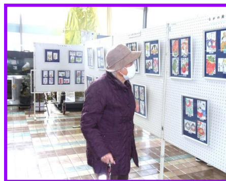
写真は、昨年の創造館での絵手紙展示鑑賞の様子写真です。

3/14（土）～3/22（日）の期間、毎年創造館では、恒例の絵手紙展示が行なわれています。今年は、当苑ご利用者様も作品を出品いたしたく思い、 鋭意制作中 です。どうぞ、ご期待下さい！