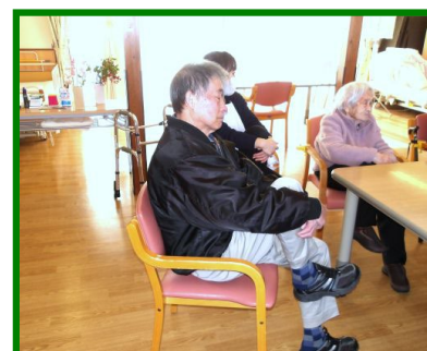
写真は、下肢機能訓練の様子写真です。さあ、後5秒頑張ってください！