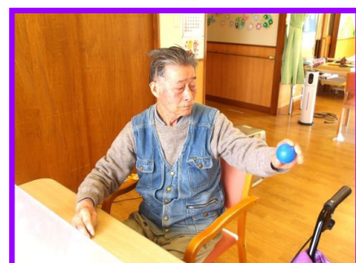
写真は、ゴムボールを用いた機能訓練の様子写真です。さあ、もう一頑張り！