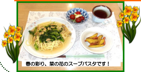
春の彩り、菜の花のスープパスタです！