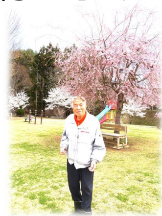
写真は、昨年のお花見ピクニックの様子写真です。風流ですね～！