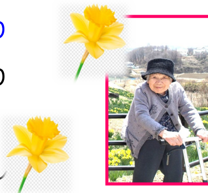
写真は、昨年の丸子音楽村水仙鑑賞の様子写真です。