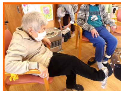
写真は、ゲーム感覚の下肢機能訓練の 様子写真です。さあ、上手くいったぞ！