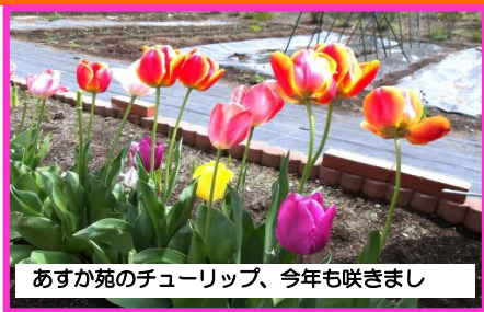
あすか苑のチューリップ、今年も咲きまし