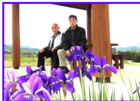
上の写真は、昨年5月にお出かけした 西前山の“アヤメ街道”見物の時の写真 です。