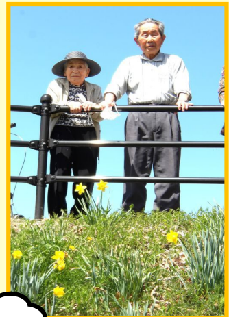
丸子音楽村の 水仙

春…お花見のいい時期になりましたね！ 先月号でご案内しましたとおり、春のお花見ドライブやお花見ピクニックに行ってみましたので情景写真をどうぞ、ご覧下さい！