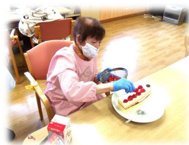
写真は、昨年行なった イチゴのショートケーキ作りの 様子写真です。色鮮やかですね～！

今年も、春の“お花見弁当”を作って楽しみ ました。季節感と創造性にあふれるお料理作 りや、芸術作品作りにチャレンジいたします。