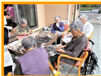
みんなで輪になって、庭先で焼き芋をいただきました。温かい一時です…