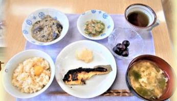
秋の「栗御飯」膳です。