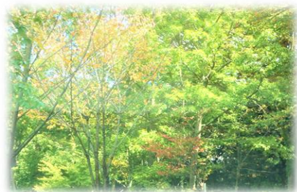
写真は、野倉の紅葉風景です。