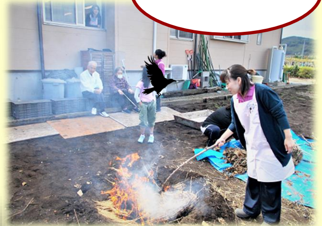
あすか苑ファームで、焼き芋です。焼けたかな…？