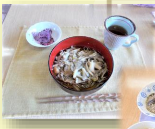
手作りきのご蕎麦です。松茸あるかなあ…