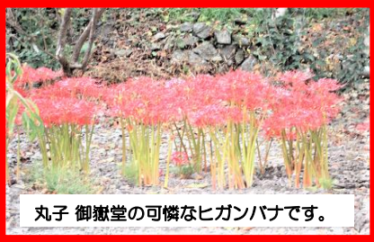
丸子 御嶽堂の可憐なヒガンバナです。