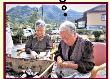
焼きたてのお芋…ほくほくして本当に美味しいですね！