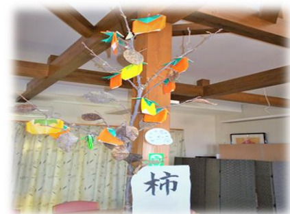
写真は、作品例の一つとして、折り紙で作った柿の木を掲載しています。