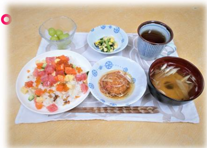
写真は、「手作りちらし寿司」膳です。