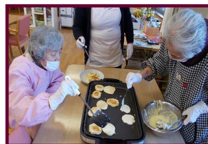
写真は、パンケーキ作りに勤しまれておられる様子です。

色彩豊かな季節感を味わうのは、お食事についても大切です。秋は、“食欲の秋”とも申します。“秋の味覚”と言える食材を用いて、ご利用者様と共に、“手料理”を楽しみます。