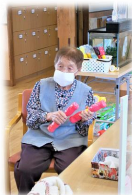
写真は、上肢機能訓練の様子です。