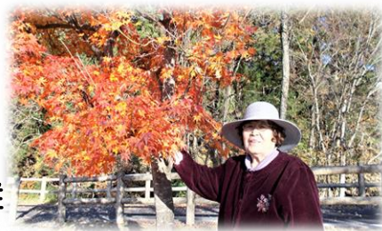
写真は、昨年の紅葉巡りドライブにおける山王山公園での情景写真です。

前山を中心とした美しい紅葉が、目にも色鮮やかです。恒例の“紅葉巡り”に出かけたいと思います。