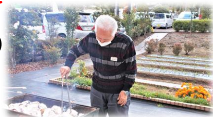
写真は、昨年の“秋の炭焼きイモ”に勤しまれておられる様子と蕎麦定食の写真です。