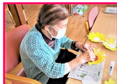
上の写真は、昨年制作した夏の風物詩“ひまわり”の壁画作りの写真です。

これからの季節は、“夏”…暑さも厳しくなりますが、夏は爽快で生命生き生きとした時季です。“夏”らしい爽やかな芸術作品作りを楽しみたいと思います。