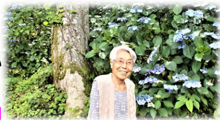
写真は、昨年の“アジサイ小道”見物のご様子です。青色が鮮やかなアジサイが大輪の花を咲かせていました。

今年も、前山のきれいな額アジサイが美しく咲いています。気候を見ながら、見物に出かけたいと思います。また、川西の蓮池の見物も計画しています。お楽しみに！！