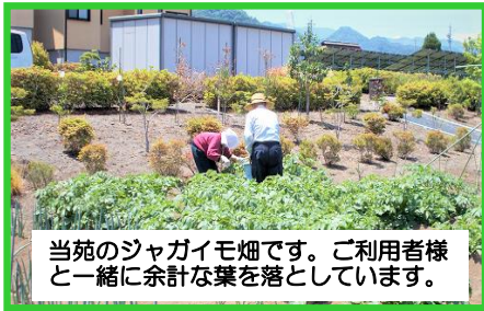
当苑のジャガイモ畑です。ご利用者様と一緒に余計な葉を落としています。