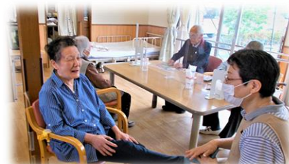
写真は、下肢可動域機能訓練のご様子です。

当苑の看護師が機能訓練指導員として、ご利用者様お一人お一人の心身機能の状態を踏まえて、適切な機能訓練を室内にて行なっております。また、 塩田病院様と連携し、ご利用者様お一人お一人に適切な機能訓練メニューを作成して、提供しています。