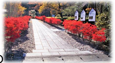
写真は、昨年の紅葉巡りドライブにおける情景写真です。