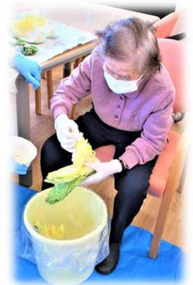
写真は、昨年の“白菜漬け”作業に勤しまれておられる様子の写真です。