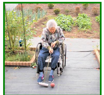
写真は、マレットゴルフの様子です。