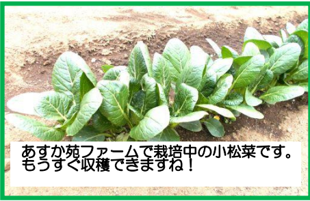
あすか苑ファームで栽培中の小松菜です。もうすぐ収穫できますね！