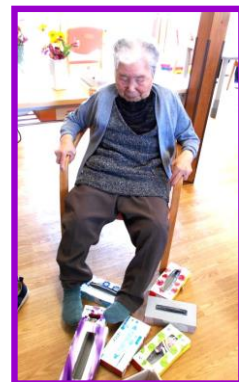
写真は、ゲーム感覚の下肢機能訓練のご様子です。