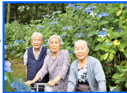
写真は、昨年の“アジサイ小道”見物のご様子です。青色が鮮やかなアジサイが大輪の花を咲かせていました。

今年も、前山のきれいな額アジサイが美しく咲いています。楽しみです！日替わりで見物に出かけたいと思います。お楽しみに！！