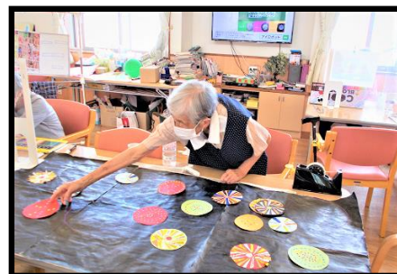
上の写真は、昨年制作した夏の風物詩“花火”の壁画の制作風景写真です。“夏”らしさがよく表現されていますね。

7月、8月と夏の時季は、夏らしい風物が執り行われる時ですね。花火や夏の花巡り等の風物詩を“夏”らしい爽やかな芸術作品として表現したいと思います。