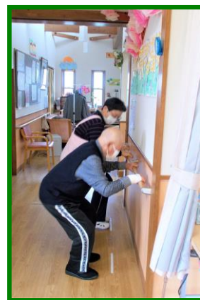
写真は、一生懸命の下肢機能訓練のご様子です。