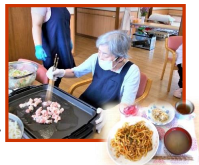
写真は、昨年の焼うどん作りのご様子の写真です。

色彩豊かな季節感を味わうのは、お食事についても大切です。秋は、“食欲の秋”とも申します。“秋の味覚”と言える食材を用いて、ご利用者様と共に、“手料理”を楽しみます。