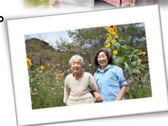
写真は、昨年の秋のひまわり鑑賞のご様子の写真です。