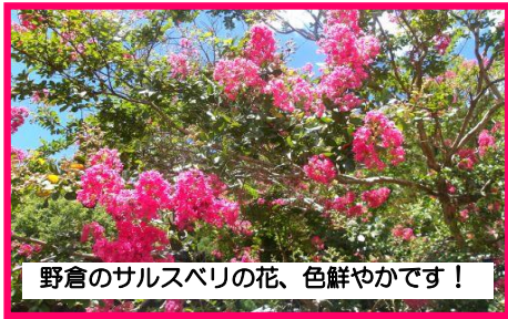
野倉のサルスベリの花、色鮮やかです！