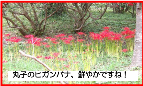
丸子のヒガンバナ、鮮やかですね！