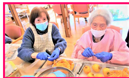
写真は、昨年の“干し柿”作りのお写真です。