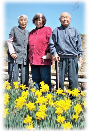
写真は、過去、“水仙”見物に出かけた折りの写真です。今年の春も、可憐な花を咲かせているでしょう!