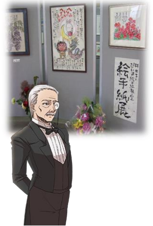
写真は、イメージ図です。