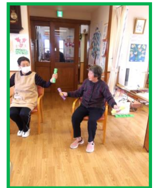
写真は、上肢機能訓練のご様子写真です。頑張ってます!