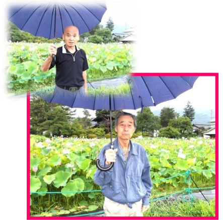
写真は、先月の“国分蓮池見物”の情景写真です。

7月下旬から、蓮の花が徐々に美しく咲き始めます。蓮の花は、朝方に咲いて、午後には花がつぼんでしまうんです。そんな儚くも可憐に咲く蓮の花を7月下旬から8月中旬にかけて鑑賞してまいりたいと思います。