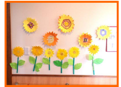
写真は、夏の風物詩“ひまわり”をモチーフとした壁画です。

色彩豊かな季節感を味わう事は、人間にとってよい刺激になります。それは、外出だけに留まらず、“作品作り”もよい効果を生み出します。先月に引き続き、“作品作り”を楽しみます。